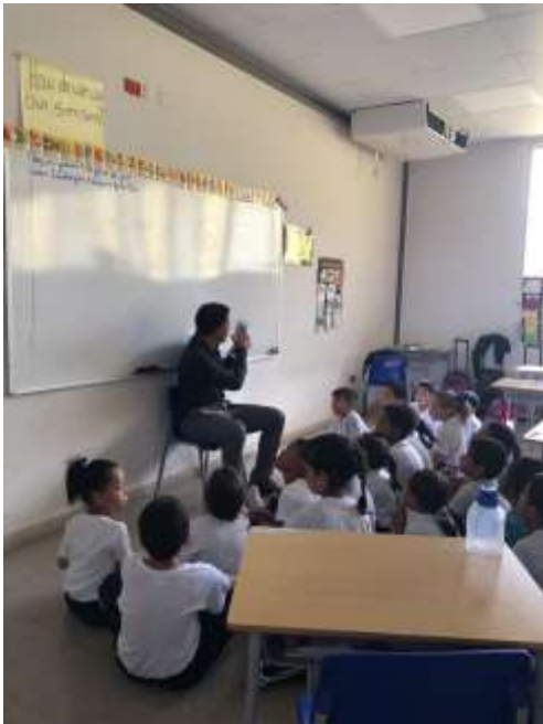
Centro Integral de Azuero Papa Francisco