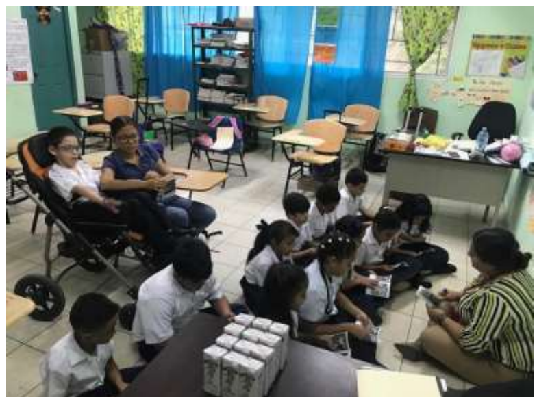
Esc. Bilingüe Juan T. Del Busto