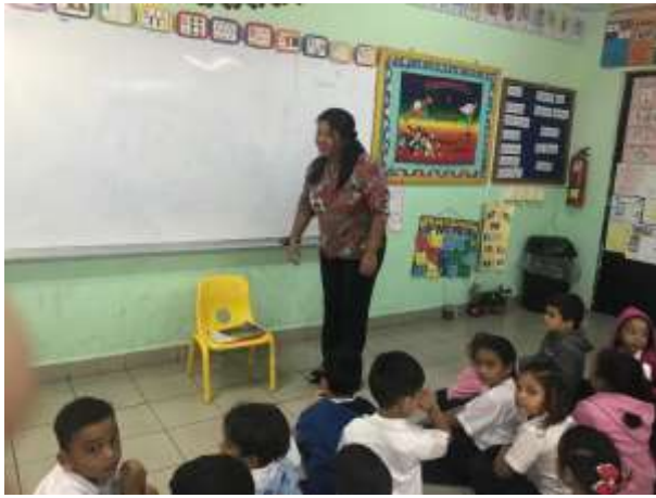
Esc. Bilingüe Juan T. Del Busto