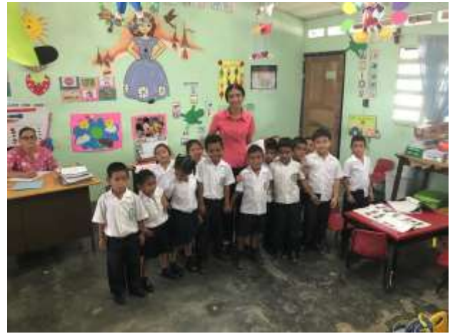
Esc. Bilingüe Boca de Parita