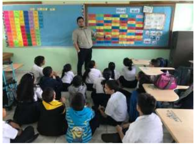
Esc. Bilingüe Hipólito P. Tello