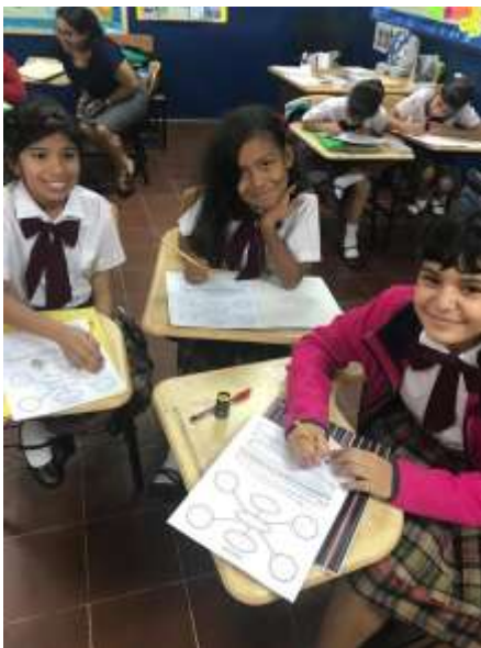
Esc. Bilingüe Evelio D. Carrizo