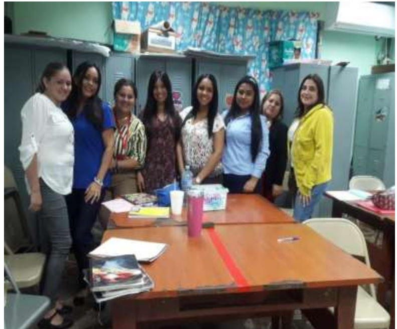
Coaching- Esc. Bilingüe Juan T. Del Busto